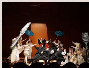
(昨年度の定期演奏会、合唱劇:注文の多い料理店の様子)