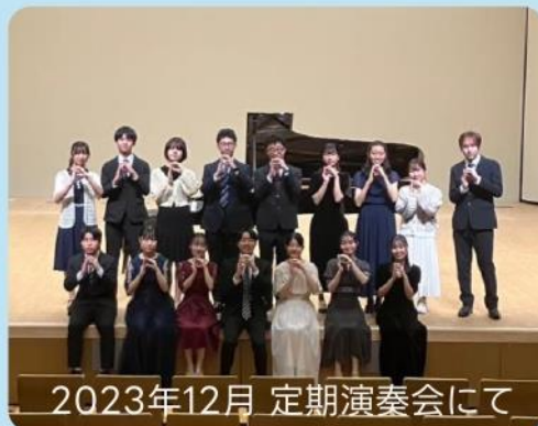
2023年12月 定期演奏会にて

経験者でも、そこそこ弾けるかもって人も。 クラシック、J-POPなどのジャンルは問いません！