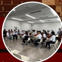
サマーコンサート♪ (撮影時期：2023/07)

部費：1,500円／月 練習日：2回／週(水・土) ※本番前：3回／週(月・水・土) 演奏会：2回／年 (Spring concert・冬定期演奏会)