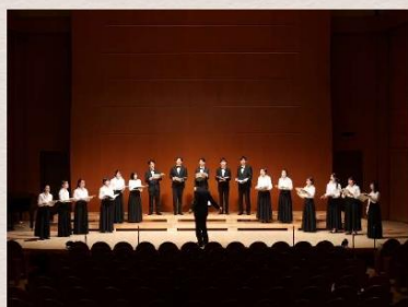
(どちらも昨年12月撮影)