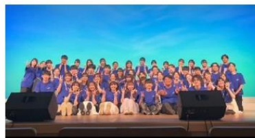
2023 夏ライブ in 金沢公会堂