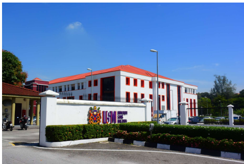
マレーシア科学大学（交換留学協定校）