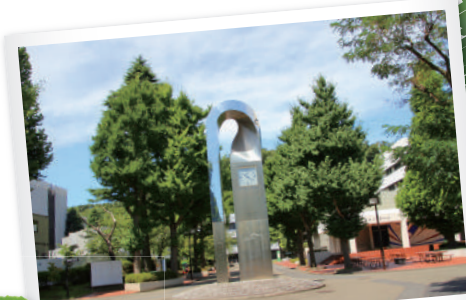
いちように囲まれた懐かしの時計台