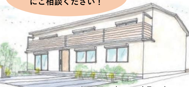
シェアハウス・イラスト