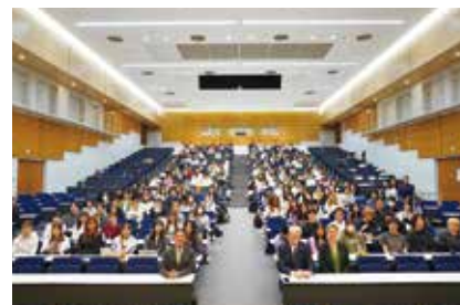
駐日リトアニア共和国大使講演会

※国際イベントは毎年実施内容が異なります。詳細はホームページや学内掲示を確認してください。