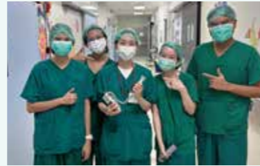
タマサート大学での臨床実習にて

実習先例:タマサート大学、スタンフォード大学、Nemours小児病院、UCSD、パリ・シテ大学、ストラスブール大学、KU Leuven、ミュンヘン大学、NIH 等