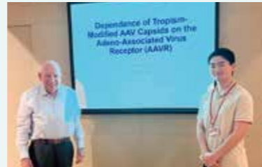
コーネル大学でのリサーチ・クラークシップにて

実習先例:ウェイン州立大学、コーネル大学、スタンフォード大学、ストラスブール大学 等