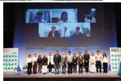
アジア・スマートシティ会議参加学生グループ