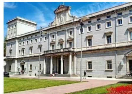
(上) ナバラ大学の本校舎 (下) 「牛追い祭り」の光景

このプログラムは、ナバラ大学の法学部へ学生を留学生として派遣しています。法学部はナバラ大学の最も古い学部で、21世紀のチャレンジに備えるため、強力な基礎と新しい技術をあわせた質の高い教育を実践しています。