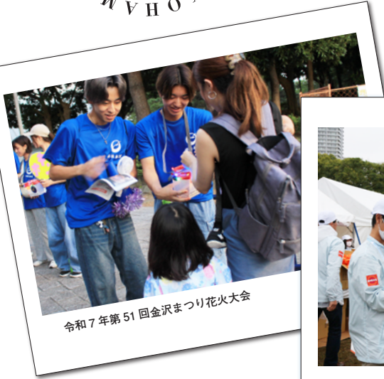
令和7年第51回金沢まつり花火大会