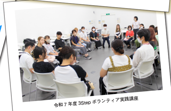
令和7年度3Step ボランティア実践講座