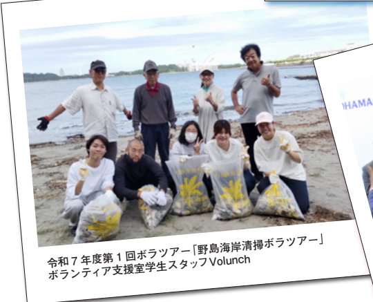
令和7年度第1回ボラツアー「野島海岸清掃ボラツアー」 ボランティア支援室学生スタッフVolunch