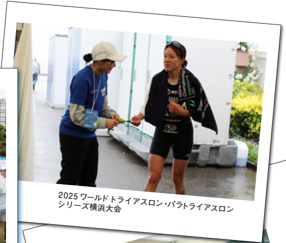
2025 ワールドトライアスロン・パラトライアスロン シリーズ横浜大会