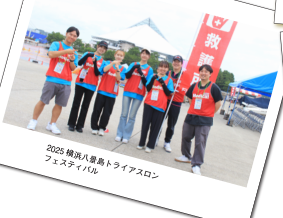
2025 横浜八景島トライアスロン フェスティバル