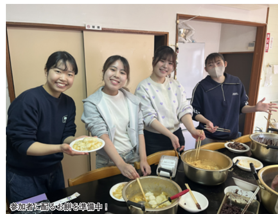
参加者に配るお餅を準備中！

◆最近では少なくなってきている町内会の深い交流が感じられてとても感動しました。これからはイベント当日だけではなく計画の段階からサ