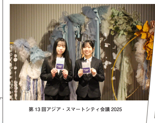
第13回アジア・スマートシティ会議 2025