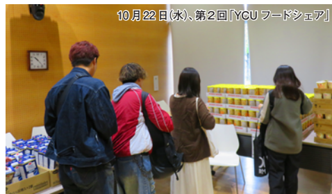
10月22日(水)、第2回「YCUフードシェア」