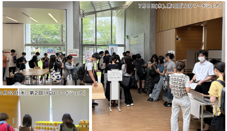
7月8日(火)、第1回「YCUフードシェア」

「YCUフードシェア」に変更したことでアンケートでも、「以前の食の支援の時は自分なんかを受け取っても平気かと少し躊躇っていたところが、つかう責任として捉え直せるようになりありがたい」「生活の支援ではなく、食品ロス削減という目的があることで、食品を受け取りやすく、私た