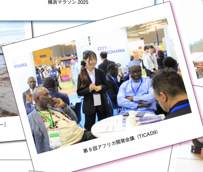
第9回アフリカ開発会議 (TICAD9)