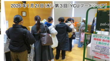
2026年1月21日(水)、第3回「YCUフードシェア」

ちもSDGsに貢献することができたという意識が生まれると思いました」という意見があり、この取組の成果は表れているといえるでしょう。また、第3回事後アンケートでは、94%の学生が「食品ロスやSDGs目標12「つくる責任・つかう責任」に対する関心が高まった/とても高まった」と回答してくれました。