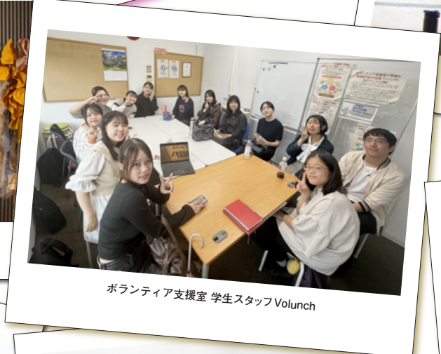
ボランティア支援室 学生スタッフVolunch