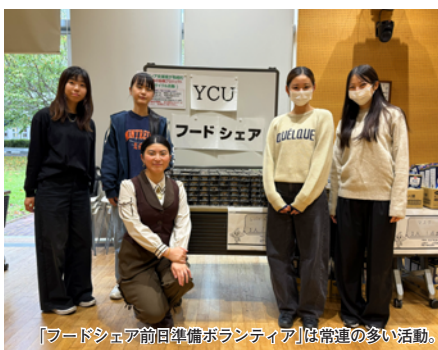
「フードシェア前日準備ボランティア」は常連の多い活動。

「YCUフードシェア」の際は、昨年度までの「食の支援」の時と同様に、前日の準備ボランティアを募集しています（ボランティア証明書対象活動）。毎回4～5名、多い時は10名ほどの学生が参加しますが、継続的に参加してくれる常連の多い活動です。搬入時のカゴ車運搬から始まり、種類ごとの仕分け、配布品を出して配架、ダンボールの片づけ、「1人〇個」等の表示貼りなど力仕事も多いのですが、その分様々な食品のことを知れる活動です。また作業しながら学年を超えたおしゃべりにも花が咲き、皆楽しみながら活動してくれています。最後はボラ室からの活動のお礼として、好きな品を持ち帰ってもらっています。