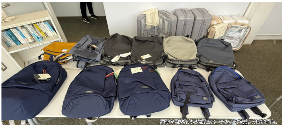
留学や部活などで必須のスーツケースやバック類を配布。

2025年度は社会福祉法人横浜市社会福祉協議会にお声がけいただき、同協議会が協定を締結している株式会社ロフトから生活が厳しい大学生向けに、バッグ・スーツケースなどの日用品の寄贈がありました。こちらは「配布日時で本学の在籍生であること」「保護者の支援が十分に受けられない状態（自宅外通学やひとり親世帯など）であること（自宅通学でも可）」「物価高のため生活費を切り詰めている状態であること」の3つの条件に当てはまる学生に事前登録（558名）してもらったうえで、日時を決めて先着順で配布