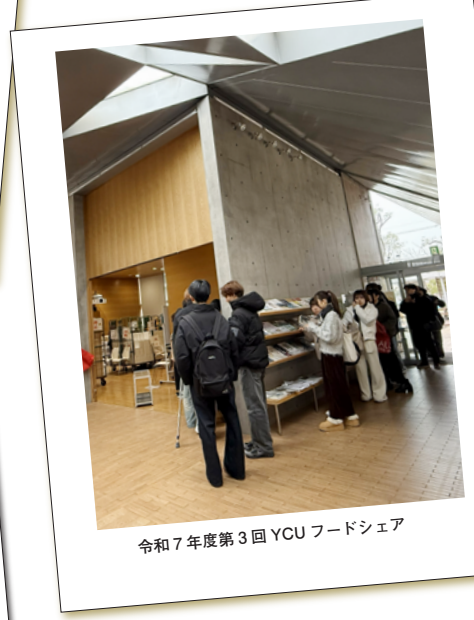
令和7年度第3回 YCU フードシェア