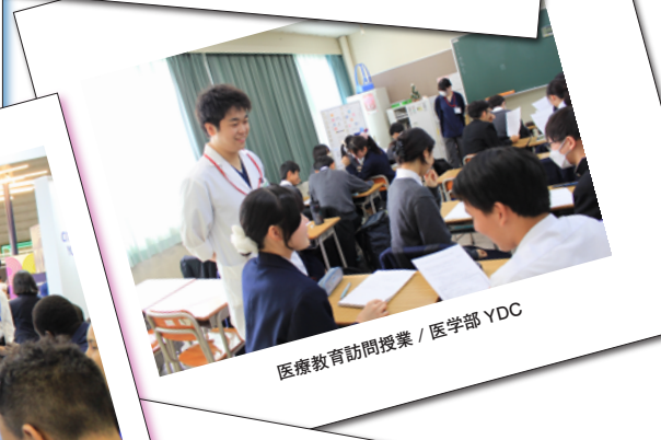
医療教育訪問授業 / 医学部 YDC