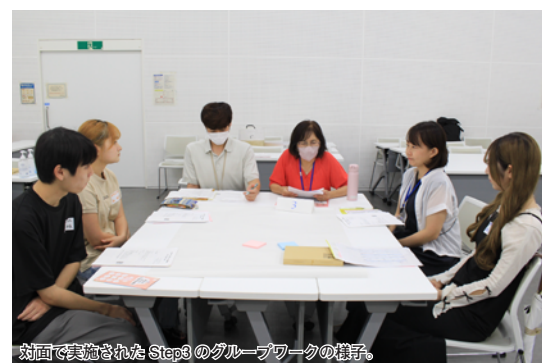
対面で実施されたStep3のグループワークの様子。

「Step3」では、夏休みのおわりに本学に集まって、グループワークを中心とした振り返りを行いました。実際に体験をした者同士が集まると会話にも花が咲きます。最後は学生、コーディネーター、職員全員が輪になって、実践講座全般や福