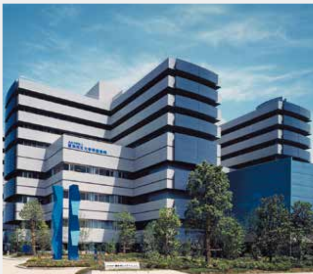
横浜市立大学附属病院

当院での初期研修プログラムを通して、地域に貢献し、高度医療も担える歯科医師の育成を行っていきます。