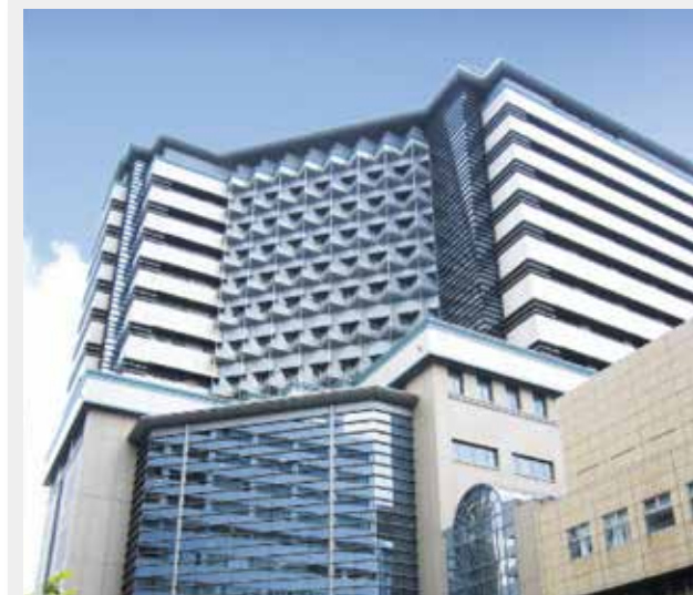
横浜市立大学附属市民総合医療センター