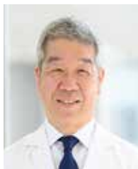
横浜市立大学 附属病院

相互に「たすきがけ」研修を行っているため、横浜市立大学附属病院・横浜市立大学附属市民総合医療センター2病院双方で、それぞれの特徴ある症例を学ぶことができます。