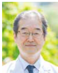
横浜市立大学附属 市民総合医療センター

あなたのこれからの道のりには多くの学びと挑戦が待っていますが、そのすべてがあなたを素晴らしい歯科医師へと導いてくれます。自信を持って、目の前の一步一步を進んでいってください。応援しています！