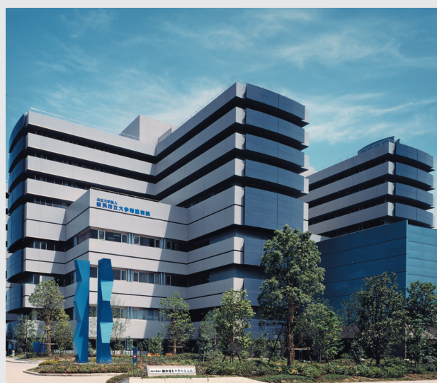
横浜市立大学附属病院

当院での初期研修プログラムを通して、地域に貢献し、高度医療も担える歯科医師の育成を行っていきます。