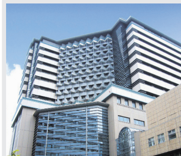
横浜市立大学附属市民総合医療センター