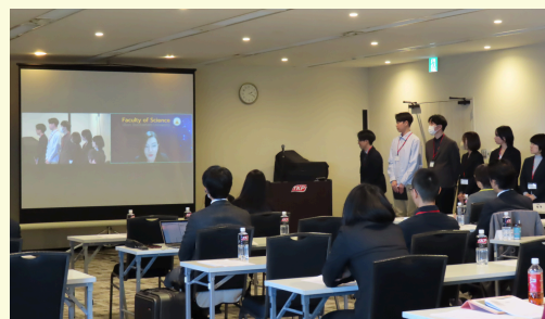
2024 SPRINGInternational Workshop (合同研究発表会)

2021年4月から、「データ思考イノベティブ人材フェローシップ」として、3年間、優秀な博士後期課程学生支援を行ってきました。文部科学省の事業統合により、2024年4月から「データ思考イノベティブ人材育成プログラム(SPRING)事業」として、支援学生数・支援内容を拡充し、支援を行っています。研究者としての研究力を向上させ、多様なキャリアパスを目指し、本学ならびに我が国の「科学技術・イノベーション」に貢献する人材を育てます。