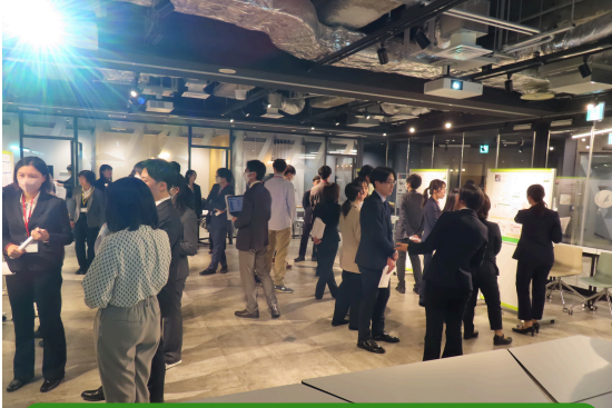
2024ポスター発表・情報交換会

場所 横浜ランドマークタワー25F TKP会議室 および Zoom ※ポスター発表・情報交換会も同日開催