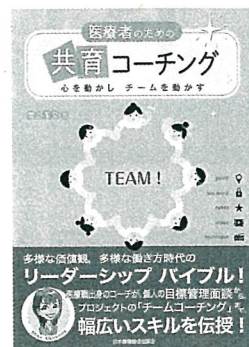
奥山美奈著 日本看護協会出版会 2,200円

NICUを退院した子どもを在宅でケアする上で重要なことは障害や発達に合わせた適切な「療育」であるとし、重度障害児の出生から就学までの療育支援やケアサービスの実際をカラー写真・図表を多用しビジュアルに解説。看護師ほか療育に関わる全専門職に有用です。就学児から成人までが対象の既刊『写真でわかる重症心身障害児（者）のケア アドバンス』を補完する書。