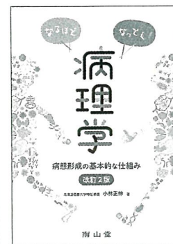
小林正伸著 南山堂 2,200円

女性の生涯にわたる健康維持・促進を見据えたケアを提案するシリーズ書第1弾は、日本人女性の7割が抱えているといわれる「冷え症」がテーマ。冷え症と妊産婦の健康との関連性について豊富な研究実績を持つ著者が、研究成果＝エビデンスをもとに「冷え」について科学的に解説。主に助産師や助産学生に向け、現場ですぐ活かせる具体的なケア方法を紹介しています。