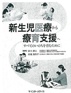
鈴木康之・舟橋満寿子編 インターメディカ 4,200円