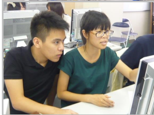
【昨年度・第 5 回の様子】