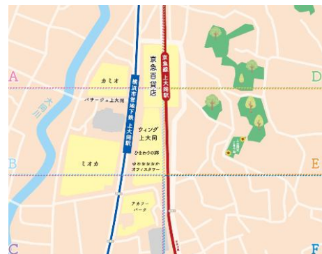
上大岡推しマップ（イメージ）