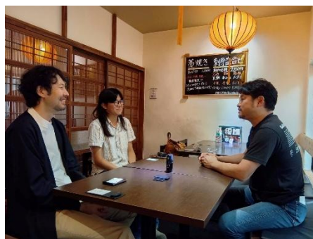
Podcast 収録・インタビューの様子