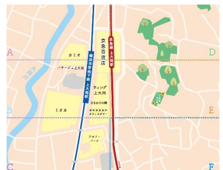
上大岡推しマップ（イメージ）