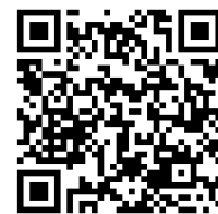
草の根二次元コード

※Podcast「草の根」とは、横浜市立大学の根本ゼミナール（Transformative Service Design Lab：TSDLab）に所属するメンバーが配信している音声コンテンツです。