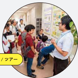
施設公開 / ツアー