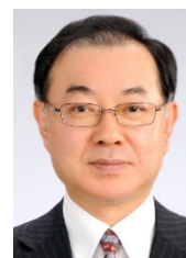
田村 功一 教授