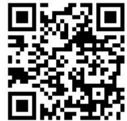
公式 Twitter QR コード

公式 Twitter： https://mobile.twitter.com/ycumfes