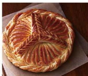
2016年1月／第二弾 地産地消をテーマ 「浜なしガレット」