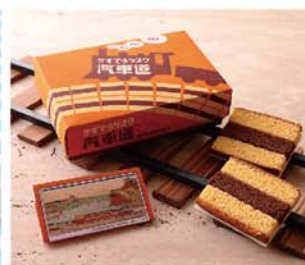
2017年3月／第四弾 児童虐待防止オレンジリボン運動 「横浜かすてらラスク 自動車」

問合せ先：株式会社 三陽物産 営業部／横浜市中区長者町9-155 Tel.045-251-8642