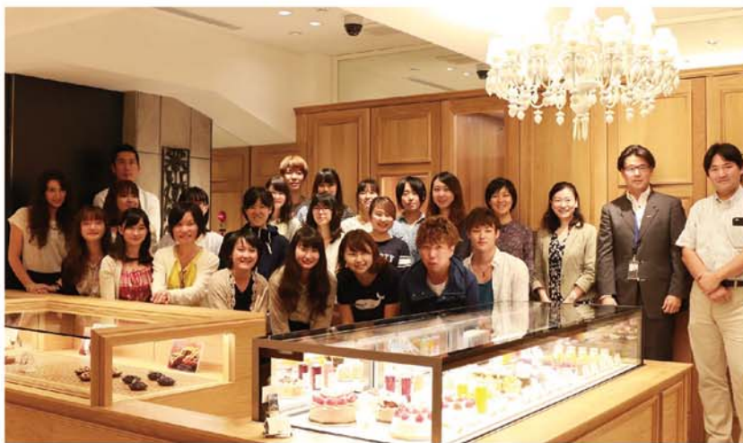
横浜市立大学の皆さんと MONTE ROSA 店内にて

そしてこのたび、第五弾となる「横浜市開港記念会館100周年記念タンブラー」が発売となりました。今後もプロジェクトにおいて、社会の役に立てる横浜の新たなお菓子を開発検討中です。