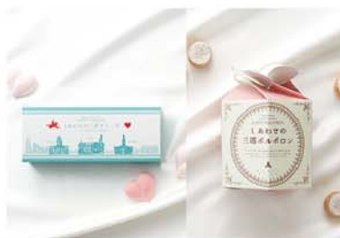
2015年11月／第一弾 横浜の歴史的建造物の周知と保全 左「しあわせの三塔ギモーヴ」 右「しあわせの三塔ポルポロン」