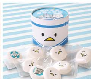
2016年7月／第三弾 帆船日本丸の保全活動支援 「ヨコハマのカモヘイマシュマロ」