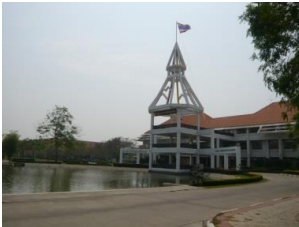
タマサート大学（タイ）

大学間の協定に基づき派遣される交換留学プログラム。姉妹都市等に所在する7大学より選ぶことができます。（対象学年：出発時に学部2年生以上）