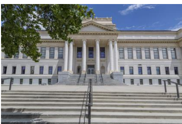
ユタ大学（アメリカ）