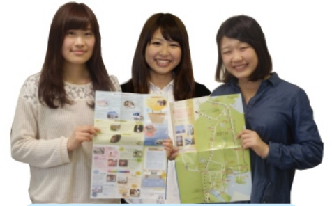
マップ作成メンバー