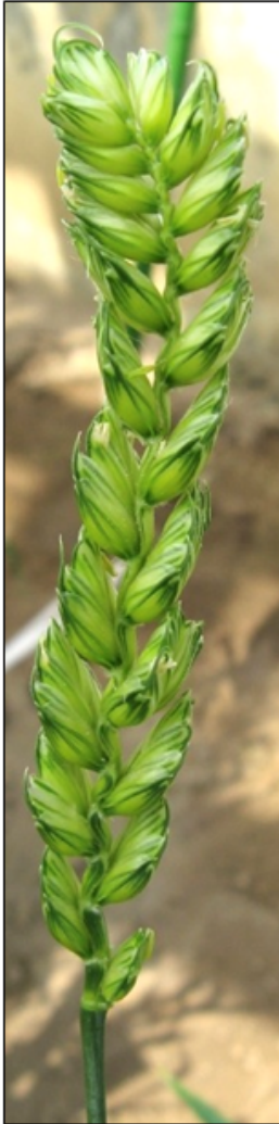
チャイニーズスプリングの穂