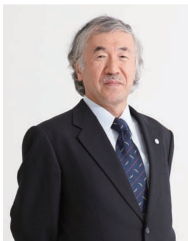
横浜市立大学学長