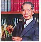
木原 均 博士

横浜市立大学の舞岡キャンパスにある木原生物学研究所は、コムギ博士として知られる木原 均 (1893-1986) が創設した研究所です。生物の多様性と進化から地球環境の変化と人類発展の歴史を学び取り、子供たちに未来を託すために、食食同源に通じてSDGs達成に貢献する植物科学・食料科学の教育と研究を進めています。