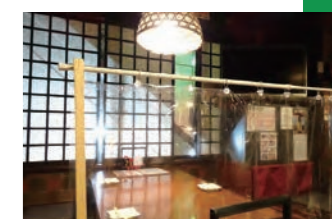
飛沫防止や換気中の店内

長期休業後は営業時間を短縮して再開したものの、5月の売り上げは8割減となりました。そんな中、常連客のアイデアがきっかけとなり、当面の従業員の給与や家賃など運転資金を得るためにクラウドファンディングのプロジェクトを立ち上げました。このプロジェクトは新聞で紹介され、かつ、常連客など多くの方が情報を拡散し応援してくれたおかげで目標金額を達成することができました。また、これをきっかけに、店にはたくさんファンがいることを改めて実感することができ、だからこそ絶対に店を守りたい、頑張りたい、という思いが強くなりました。