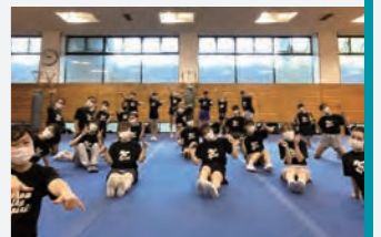
マスク着用で集合

くいました。しかし、すぐにリモートで練習を再開し、新入生を迎えることもできました。夏に幹部交代を行い、対面練習を再開しましたが、コロナの影響で今までと体制が大きく変わり、大変なことがたくさんありました。感染対策としてソーシャルディスタンスを確保するため、スタント（組体操のように複数で構成する演技）ができないなど、以前のような活動ができておりません。しかし、タンプリング（マットの上で行うアクロバット技）、ダンスなど、今だからこそ集中して磨ける技を一生懸命練習し、バーチャルでの大会に備えています。コロナ禍が収束する頃には、更にレベルアップしたSEAGULLSをお見せできるよう頑張っておりますので、引き続き応援よろしくお願いたします。