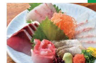
お店自慢のお刺身

例年であれば、12月には多数開催されるはずの忘年会の予約はなく、今も売り上げは落ち込んだままです。しかし、店のファンの皆様のためにも、従業員の生活を守るためにも、できる限りの感染対策を実施し、県の要請に従いながら営業を続けています。早く以前のような、にぎわいが戻ることを願っています。