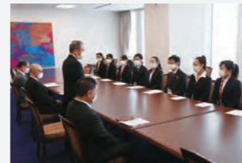
横浜市副市長表敬訪問

SEAGULLS（シーガルズ）は入学式や卒業式での応援団との演舞、東京都立大学との対抗戦での応援、浜大祭でのステージ披露に加えて、様々な大会への出場など活躍の場を広げています。2019年8月に行われた国内大会ではミスのない演技で準優勝し、2020年2月にアメリカのアナハイムで開催された国際大会USA Collegiate Championships 2020への出場権を手に入れました。国際大会では本場アメリカのチアリーダーの雰囲気にも刺激を受けながらも、チームの努力が実を結び、初出場ながら部門の準優勝という快挙を達成しました。また、11月には国際大会での準優勝を報告するため、横浜市へ表敬訪問し、この様子はtvk（テレビ神奈川）のニュースでも報じられました。そして2021年1月には横浜市金沢区の区民に夢と希望と感動を与えた個人や団体に贈られる金沢区民栄誉賞を受賞しました。