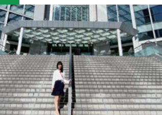
東京2020組織委員会のオフィスビル