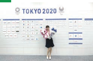
東京2020組織委員会のエントランス

新型コロナウイルスが世界中で流行する中で、どのような形で開催できるのか正直不安はありますが、今は開催に向けてできる限りの準備を一步一步進めています。先が不透明で、最後の最後まで難局が続くと思いますが、市大の卒業生としての誇りを持って、最後まで開催に向け尽力したいと思っています。