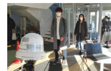
サーマルカメラで入館時に検温を実施