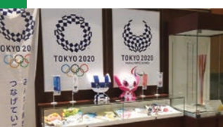
スポーツ庁のエントランス