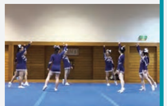
間隔を保ち演技の練習

みんなの気持ちを1つにまとめるのは本当に大変でした。チアリーダーは「チームワーク」が命。そういったお互いの信頼関係が今のチームから見て取れます。コーチとのやり取りなどを通じて、真の対人マナーを身に付けられていることもSEAGULLSの特徴だと思います。