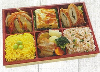
1002 山茶花 (サザンカ) 特定原材料：小麦・卵・乳 本体価格 1,080円(税込)