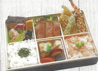
2104 福郷 (ふくさと) 特定原材料：小麦・卵・えび・かに 本体価格 2,160円(税込)