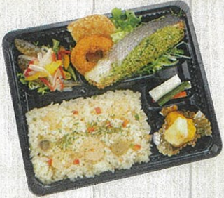
0802 洋風ピラフ&サーモンの 香草パン粉焼き 特定原材料：小麦・卵・乳・えび 本体価格 864円(税込)