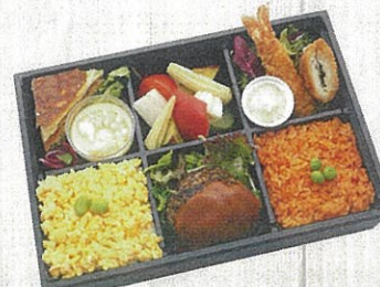
1903 特製デミハンバーグ & エビフライ弁当 特定原材料：小麦・卵・乳・えび 本体価格 1,944円(税込)