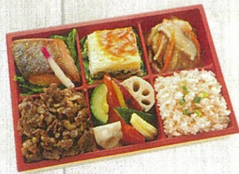
1302 折鶴 (おりづる) 特定原材料：小麦・卵・乳 本体価格 1,350円(税込)