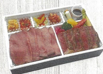
2701 牧草牛のローストビーフ重と ステーキ御膳 特定原材料：小麦・卵・乳 本体価格 2,700円(税込)