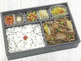
1902 国産黒毛和牛の すき焼き弁当 特定原材料：小麦・卵・乳・えび・かに 本体価格 1,944円(税込)