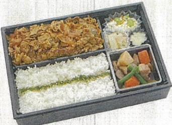
1301 牛亭の焼肉御膳 特定原材料：小麦・卵・乳 本体価格 1,350円(税込)