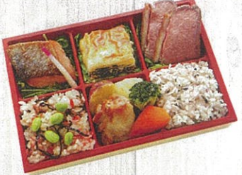
1603 福武 (ふくたけ) 特定原材料：小麦・卵・乳・えび 本体価格 1,620円(税込)