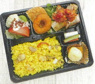
0901 地中海風パエリア & ロテサリーチキン 特定原材料：小麦・卵・乳・えび 本体価格 972円(税込)