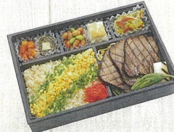
2102 柔らか牛タンのがりル弁当 特定原材料：小麦・卵・乳・えび・かに 本体価格 2,160円(税込)