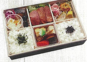
1901 福入 (ふくいり) 特定原材料：小麦・卵・乳・えび 本体価格 1,944円(税込)