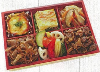
1602 紅鶴 (べにづる) 特定原材料：小麦・卵・乳 本体価格 1,620円(税込)