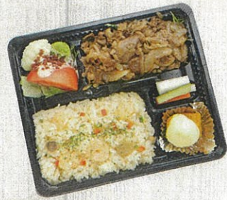
0801 洋風ピラフ&ビーフソテー 特定原材料：小麦・卵・乳・えび 本体価格 864円(税込)