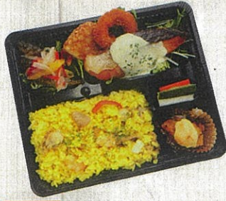
0902 地中海風パエリア&サーモンの 西京みそクリームソース 特定原材料：小麦・卵・乳・えび 本体価格 972円(税込)