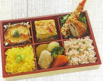
1001 紫陽花 (アジサイ) 特定原材料：小麦・卵・乳・えび 本体価格 1,080円(税込)