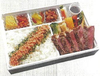
2101 牧草牛のステーキ御膳 特定原材料：小麦・卵・乳 本体価格 2,160円(税込)