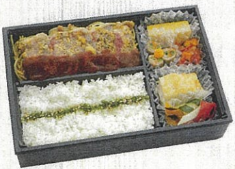
1601 焦がしチーズの牛ロース御膳 デミグラスソース 特定原材料：小麦・卵・乳 本体価格 1,620円(税込)