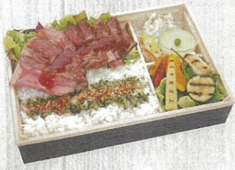
2103 牧草牛のサーロインステーキ 10枚和風おろしソース 特定原材料：小麦・卵・乳 本体価格 2,160円(税込)