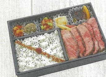
2702 国産霜降り牛の ステーキ弁当 特定原材料：小麦・卵・乳・えび・かに 本体価格 2,700円(税込)