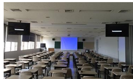
写真② 看護研究棟大教室整備