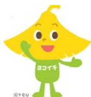
横浜市立大学 キャラクターヨッチー