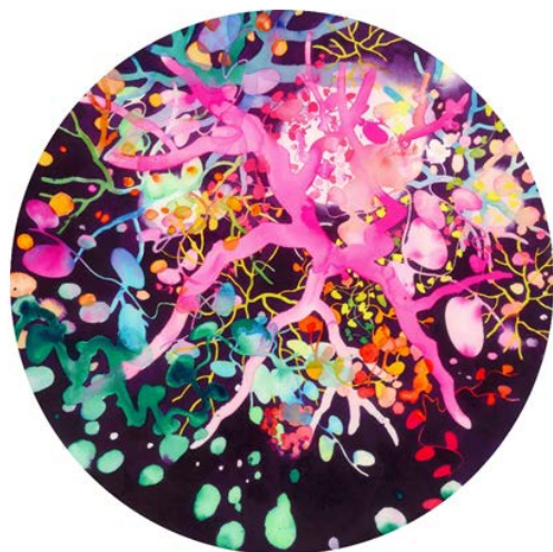
タイトル：宙-A-glow 制作年：2013 素材：紙に水彩 サイズ：59 × 59 cm 所蔵：個人蔵