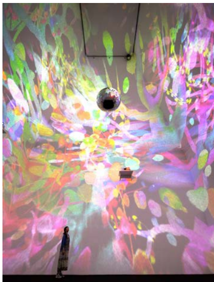
タイトル：宙(そら) 制作年：2013 素材：アニメーション、球体 サイズ：可変 展示会：曾谷朝絵展「宙色(そらいろ)」 展示場所：水戸芸術館現代美術ギャラリー、茨城 謝辞：水戸芸術館現代美術センター、茨城