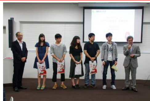
成果発表会の様子