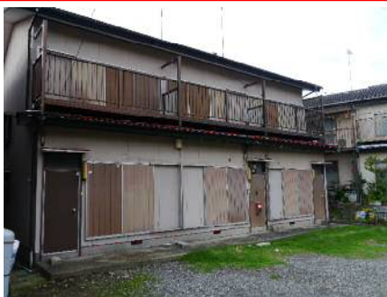
工事前の物件写真

取材の申し込みについては最終ページの申込表に必要事項をご記入のうえ， 3月6日（月）15時までにご返信ください。