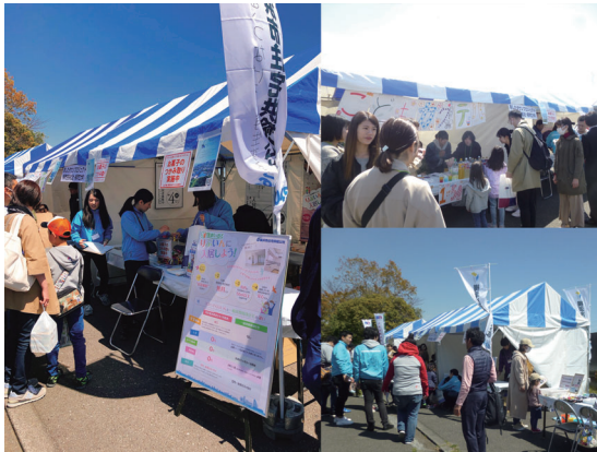
シーサイドラインフェスタ

4月13日(土)シーサイドラインフェスタが開催されました。 当日は晴天のもと、大勢の来場者で賑わいました。 来年の開催が今から楽しみです。