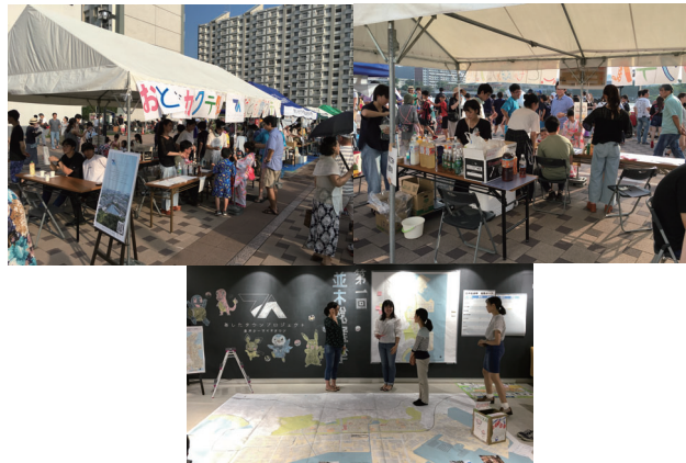
金沢シーサイドタウンサマーフェスタ

4月13日(土)シーサイドラインフェスタが開催されました。 当日は晴天のもと、大勢の来場者で賑わいました。 来年の開催が今から楽しみです。