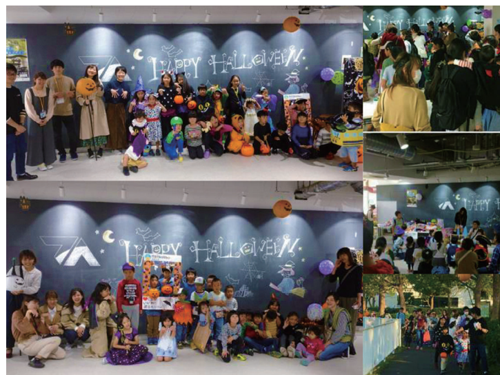
「ハロウィンパーティー」

10月27日(日)並木ラボにて横浜市立大学三輪ゼミとヨコハママナビとの合同でハロウィンイベントを開催しました。毎年人気のこのイベント、今回は約130人もの親子が参加してくれました。受付で番号札とお菓子ジュースをもらって、まずは抽選会からスタート。おもちゃをもらった子どもたちの笑顔が溢れるひと時となりました。抽選会が終わると、ふなだまりの周りを歩いてお菓子をもらいに行くまちあるきをしました。希望者だけの参加だったのですが、今年は約100人ととても多くの方に参加していただき、2チームに分かれて大賑わいの散歩となりました。可愛い仮装をした子どもたちが行列で歩くので、近隣の方も足を止めて楽しそうに見守ってくれました。 今回は、第二保育園さん、富岡並木地区センターさん、ほのほのさんに協力していただき各施設に関する三択クイズを出したり、お菓子をもらったりして楽しい一時間を過ごすことができました。