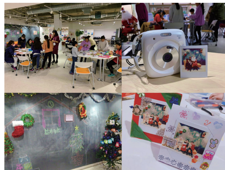
「クリスマスパーティー」

10月27日(日)並木ラボにて横浜市立大学三輪ゼミとヨコハママナビとの合同でハロウィンイベントを開催しました。毎年人気のこのイベント、今回は約130人もの親子が参加してくれました。受付で番号札とお菓子ジュースをもらって、まずは抽選会からスタート。おもちゃをもらった子どもたちの笑顔が溢れるひと時となりました。抽選会が終わると、ふなだまりの周りを歩いてお菓子をもらいに行くまちあるきをしました。希望者だけの参加だったのですが、今年は約100人ととても多くの方に参加していただき、2チームに分かれて大賑わいの散歩となりました。可愛い仮装をした子どもたちが行列で歩くので、近隣の方も足を止めて楽しそうに見守ってくれました。 今回は、第二保育園さん、富岡並木地区センターさん、ほのほのさんに協力していただき各施設に関する三択クイズを出したり、お菓子をもらったりして楽しい一時間を過ごすことができました。