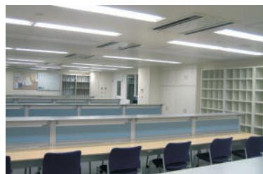
センター病院研修医室

新しい臨床研修制度が導入されてから、附属2病院ではプログラムの向上に努めてきました。まず、神奈川県近傍の中核病院と連携して豊富な指導医のもとで指導を受けることができましたようにしました。平成23年度には救急研修のプログラムを大幅に改善しました。また、2年目は県内の診療所や北海道、福島、三重、和歌山、高知、長崎、鹿児島県の病院で中身の濃い地域医療研修を受けることができるように工夫をしています。さらに、皆さんの学びや憩いの場となる研修施設の充実も行われ研修環境も良好となっています。ぜひ、横浜市立大学病院群で初期研修を受け、キャリアの基礎を築いてください。