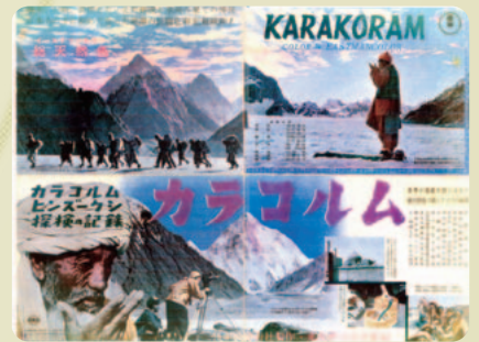
映画上映「カラコルム」