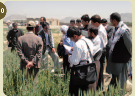
アフガニスタンのコムギ試験場 (Afghanistan, 2010.6)