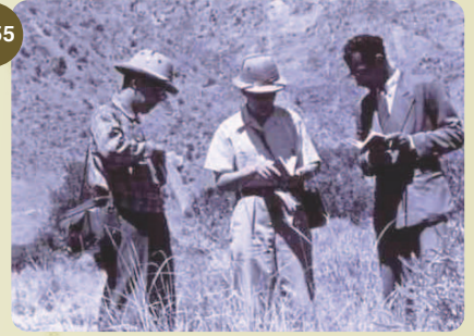
コムギのサンプルを採集する木原均博士 (Afghanistan, 1955)