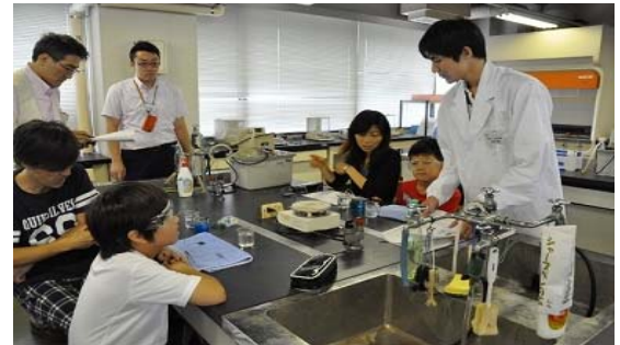
【平成 26 年度の様子】