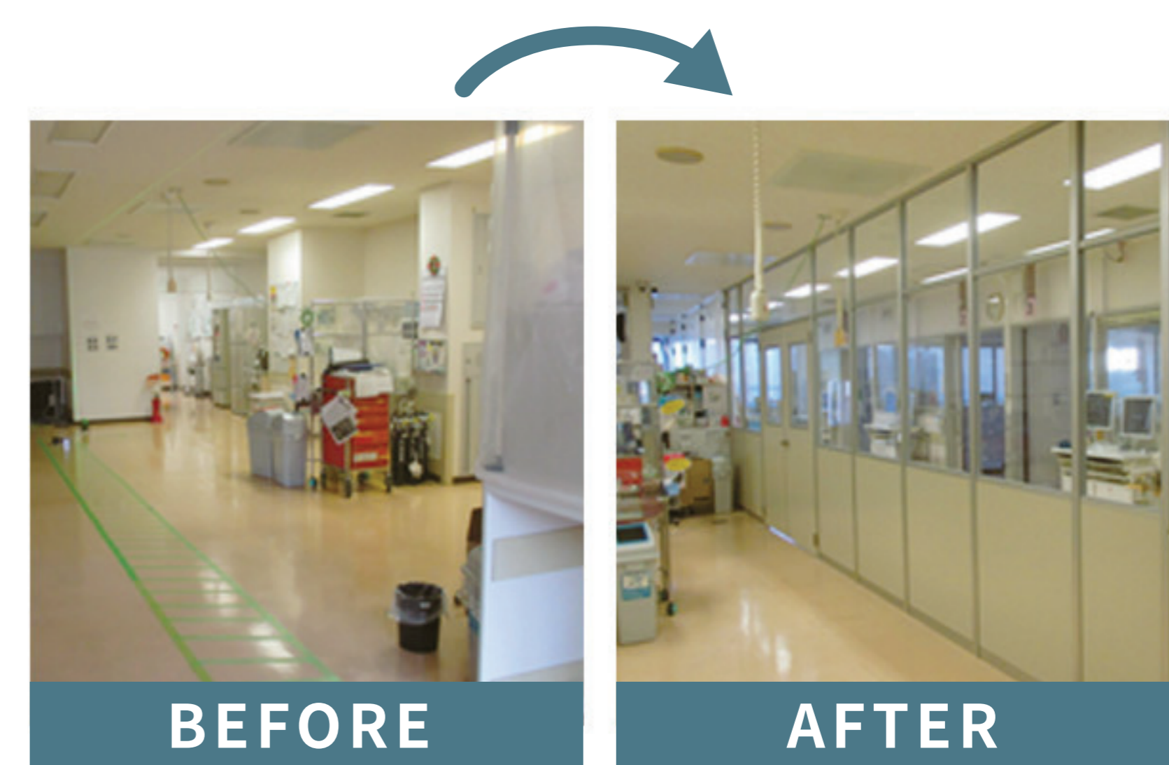
例：感染対策のための間仕切りを設置