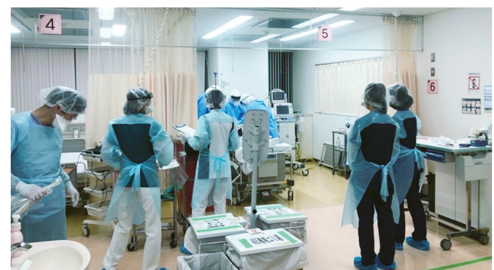
診療にあたる医療従事者