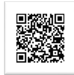
登録ページ QRコード

入力後に内容に誤りがなければ「登録」を押してください。「参加申し込み完了」に画面が切り替わります。